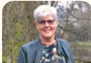
Ita Holdinga Receptie en administratie