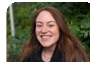
Fleur Bel Sociaal Werker